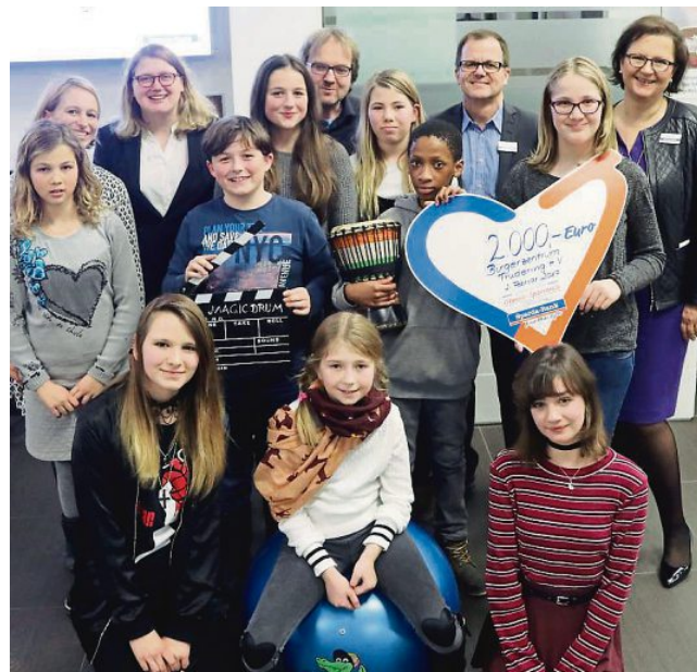
Einfach zauberhaft: Kinder des Mitmach-Musicals „Magic Drum“ aus Trudering gaben eine Kostprobe.

Der war ein voller Erfolg: Mehr als 80 Einrichtungen haben sich um eine Förderung beworben. 31 Gewinner-Projekte erhalten nun eine Finanzspritze, die je nach